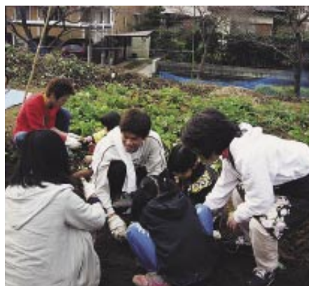
子どもたちと芋掘りを楽しむ児文研メンバー

その一方で、メンバーたちも、子どもから刺激を受けたり、接し方を模索したりしています。現在は1年生5人、2年生9人、3年生8人、4年生4人で活動中。来年、40周年を迎えるのを記念して、OB・OGとともに記念イベントの開催を企画しています。ホームページ( http://wakojibk.fc2web.com )でも活動内容を紹介しています。