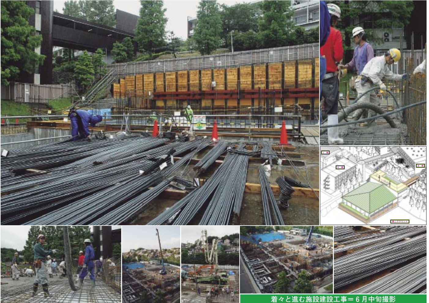
着々と進む施設建設工事＝6月中旬撮影